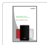
Manuel d'installation rapide