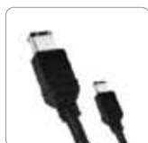
Câble FireWire 400