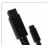
Câble FireWire 800