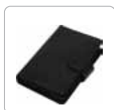
Étui de rangement