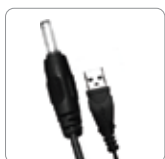
électrique en option