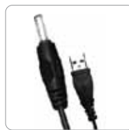
Adaptador de la CA