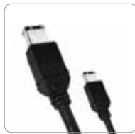
Cable FireWire 400 (1394a) de 6 pins a 6 pins