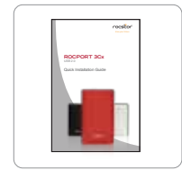
Guía de instalación rápida