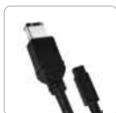
Cable FireWire 800 a 400 (9 a 6 pin)