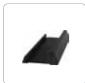
Base para montaje vertical