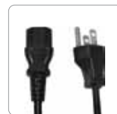
Cable de alimentación