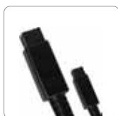
Cable FireWire 800 (9 a 9 pin)