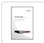
Guía de instalación rápida