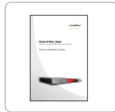
Guida all'installazione rapida