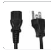
Filo elettrico standard (uso internazionale)