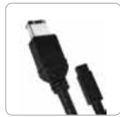
Cavo FireWire 800 da 400 (9 da 6 pin)