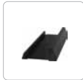
Supporto per montaggio verticale