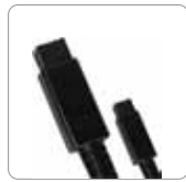
Cavo FireWire 800 (9 da 9 pin)