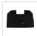
Stand zur vertikalen Anbringung