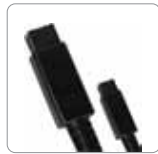
FireWire 800 (1394b) (9 bis 9-pin) Kabel