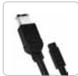
FireWire 400 bis 800 (1394a) (9 bis 6 pin) Kabel