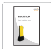
Manuel d'installation rapide