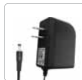
Adaptateurs d'alimentation de courant continu