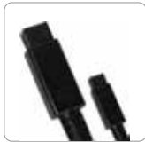
Câble FireWire 800 (1394b)