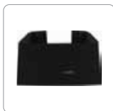
Support pour fixation verticale