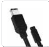
Câble FireWire 400 (1394a)