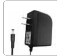
Adaptador de corriente alterna