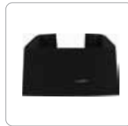
Base para montaje vertical