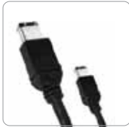
Cable FireWire 400