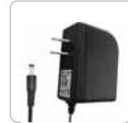
Adaptateurs d'alimentation de courant continu