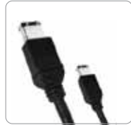
Câble FireWire 400 (1394a)