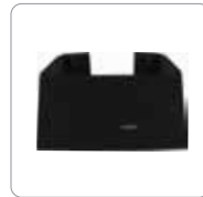
Support pour fixation verticale