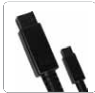
Cable FireWire 800