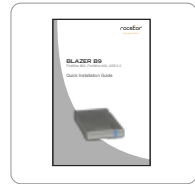
Guía de instalación rápida