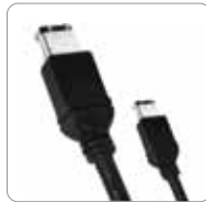
Cable FireWire 400