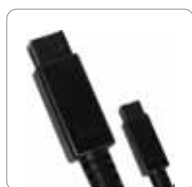
Cable FireWire 800