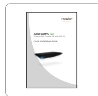
Guía de instalación rápida