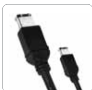
Cable FireWire 400