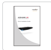
Guía de instalación rápida